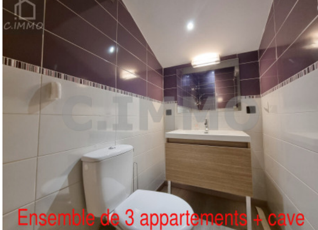
Ensemble de 3 appartements + cave