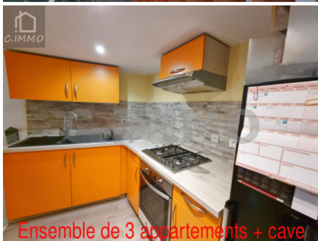
Ensemble de 3 appartements + cave