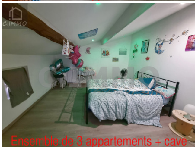
Ensemble de 3 appartements + cave