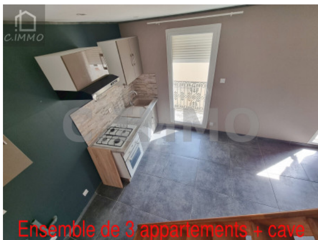
Ensemble de 3 appartements + cave