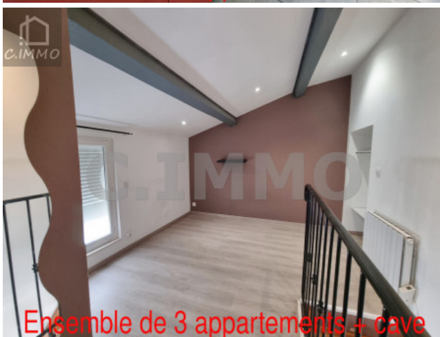
Ensemble de 3 appartements + cave