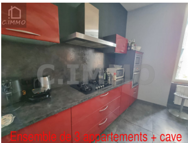
Ensemble de 3 appartements + cave