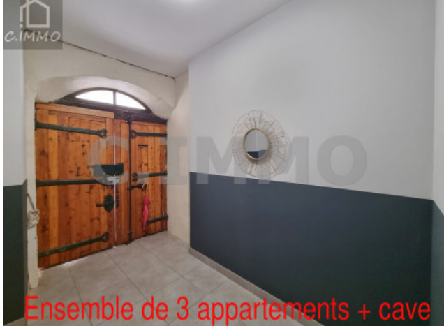
Ensemble de 3 appartements + cave