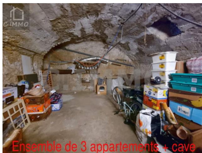
Ensemble de 3 appartements + cave