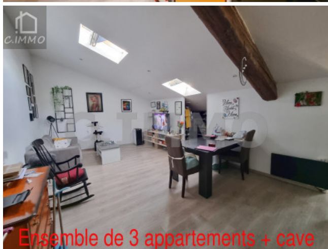
Ensemble de 3 appartements + cave