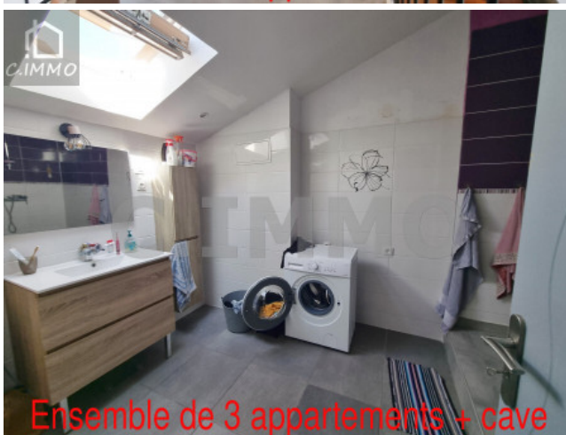
Ensemble de 3 appartements + cave