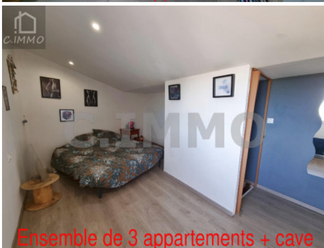
Ensemble de 3 appartements + cave